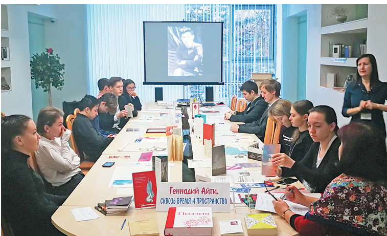
В национальной библиотеке Чувашии уроки «Творческое наследие Айги» проводятся уже несколько лет.

Благодаря друзьям во второй половине 50-х годов XX века появляются его первые публикации — пока в странах «бывшего соцлагеря». В середине 60-х годов издаются небольшие сборники стихов на словацком, чешском и польском языках. Первое двухтомное собрание сочинений Айги выходит в Германии (в России оно появится только в 91-м году). И, наконец, в начале 80-х в Париже выходит сборник стихов поэта «Отмеченная зима».