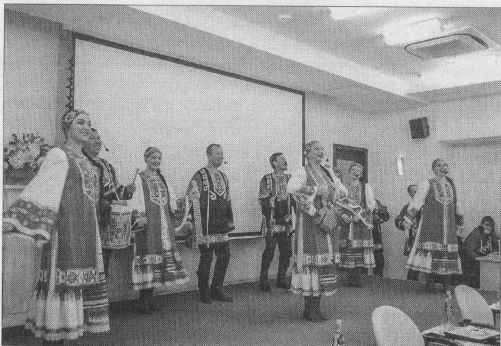
▲ В повестке дня форума не только деловые встречи, но и самобытная культурная программа

тандемом специалистов НБ и художника Олега Улангина, переворачивает привычное представление о библиотечной выставке. Каждый раздел – отдельная страница удивительной истории, в которой переплелись имена и судьбы людей, значимые эпизоды, впечатления, мгновенья прожитой жизни. Листая их, читатель пройдёт путь от самых истоков «публички», созданной в 1871 г. группой из 17 представителей чебоксарской интеллигенции, среди которых были учителя, врачи, купцы, чиновники, до современной Национальной библиотеки Чувашии. Через призму важных исторических событий по-