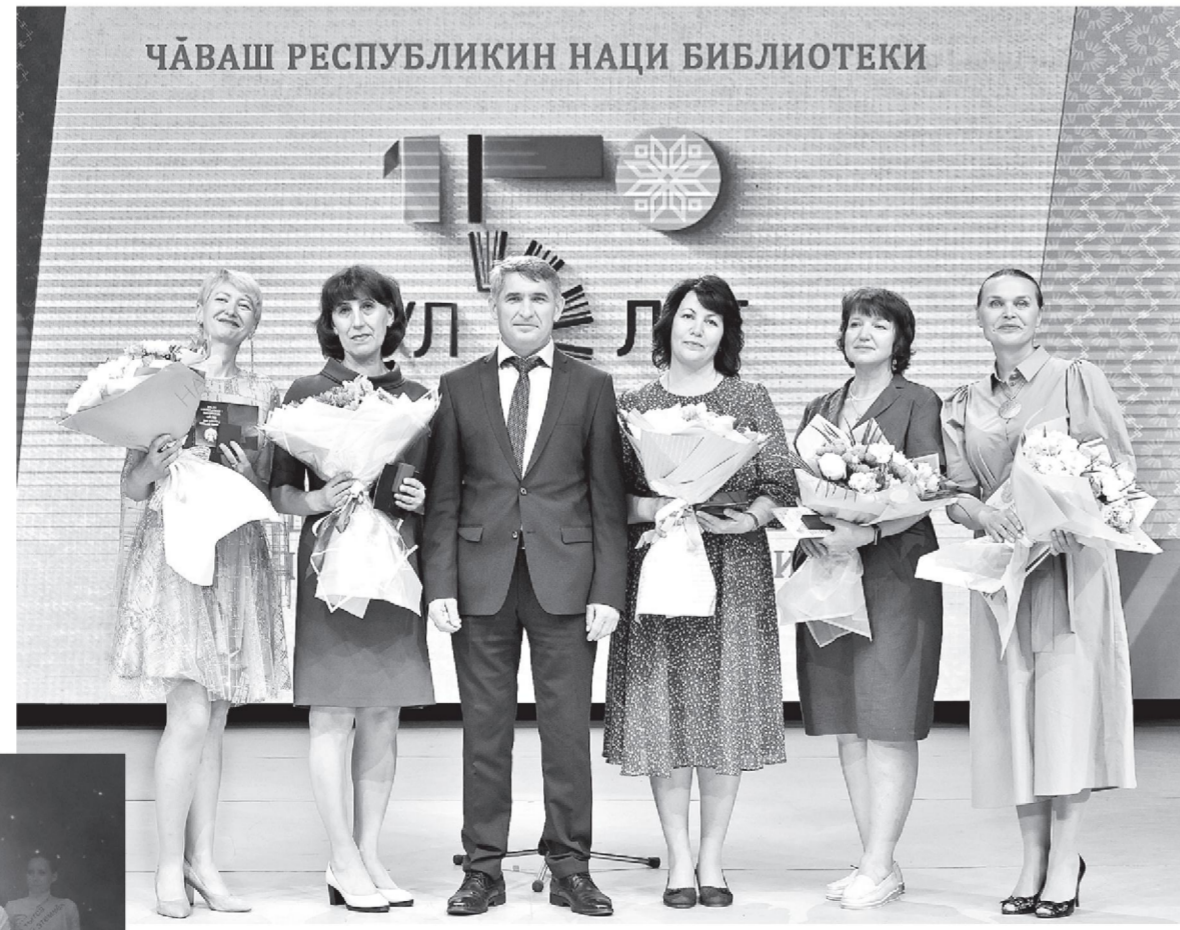
ЧАВАШ РЕСПУБЛИКИН НАЦИ БИБЛИОТЕКИ

Унта ЧР Пуслахё Олег Николаев та хушанчё. Хасанен шултен Рашсей Федерациен сенаторё, Чаваш Республикан пёрремёш президентё Николай Федоров, йттисем пулчеш. Олег Алексеевич шухашё, республикан телп вулавашё 150 сула ситни чанинпех манасланмалли самант. «Наци библиотеки лайах енене улшанине хам курса татам. Техникум, вуз студентчё пулна чухнех суререм унта, Патшалых Думин депутатчё, общество деятельё пек те таташах керсе тухрам. Кус умёненчех аталанат пирен юратна библиотека. Темисе яру саканта кёнекепе туслашна», – тереш регион ертуси. Вал пуша алапа килмен – культуран аталантарас ёсе хайсен тулпине хывисене тата Наци библиотеки 150 сула ситнё май унта чылай вахат турё камалла ёсленисене наградасеме чысларё. Чаваш Республикан Хисеп грамотине Наци библиотекин коллективё тивёсреш. «Чаваш Республикан культуран тав-