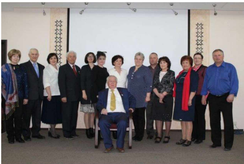
Делегация Ульяновской области на встрече с читателями Национальной библиотеки Чувашской Республики. 9 апреля 2015 г. Чебоксары.