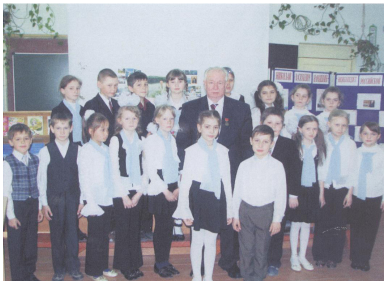
Русский писатель, академик, Почетный гражданин Карсунского района Ульяновской области Н. В. Нарышкин с учениками Карсунской средней школы 24 апреля 2009 года