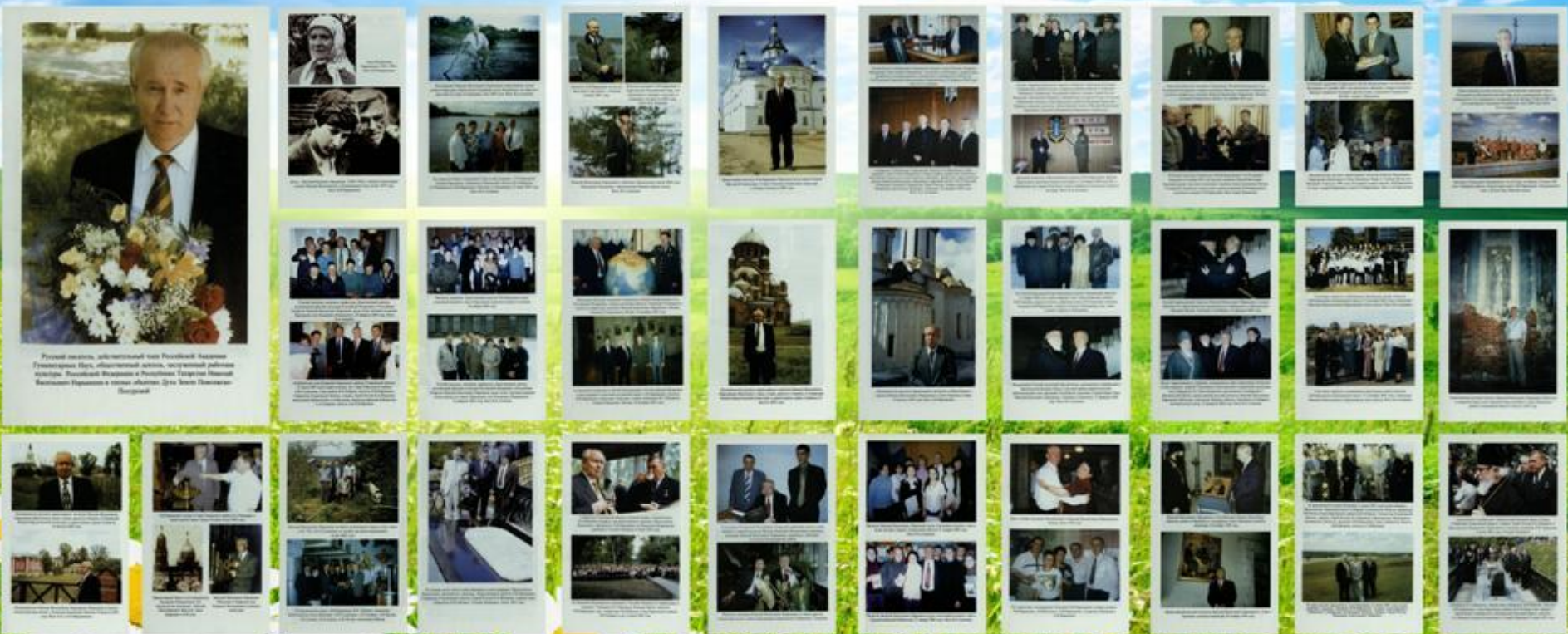
Русский человек, абсолютный сын Русской Церкви Генерал-майор, абсолютный герой, абсолютный работник церкви. Русский Владимир и Русская Татьяна. Писатель Владимир Гусев и другие.

(Выставка фотографий из I тома "Русского дневника" Н. В. Нарышкина (Махотина))