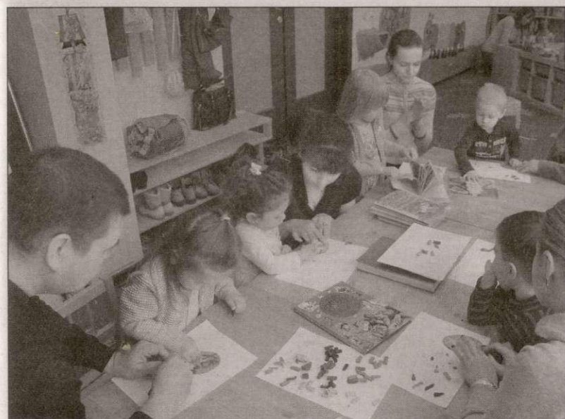
Готовимся к светлой Пасхе

ждения детской комнаты, раскрасили бумажные блины на Масленичной неделе, пластилином украсили картонное яйцо к светлому празднику Пасхи, «сконструировали» большую ракету ко Дню космонавтики. Очень живо прошла фотосессия ко Дню Победы, где каждый мог сфотографироваться в солдатской пилотке, а пришедшие всей семьёй получили несколько снимков на память.