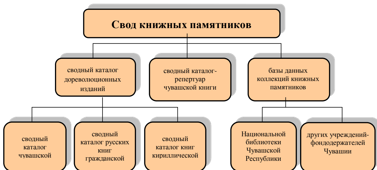
Рис. 2. Основные этапы (направления) работы по созданию Свода книжных памятников Чувашии

I направление – создание сводного каталога дореволюционных изданий, находящихся в Чувашии, который, в свою очередь, состоит из трех частей: