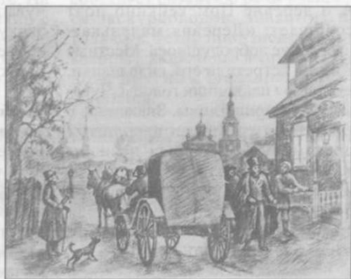
Г.Д. Харлампов. «Пушкин в Чебоксарах»