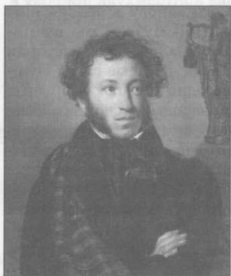
О.А. Кипренский «А.С. Пушкин» (1827)

Особое внимание в музейной работе уделяется теме «Пушкин и Чувашия». Учащиеся 5–6 классов с интересом изучают чувашскую фольклорную пушкиниану, в которой поэт представлен как фольклорный герой. Но не нужно забывать о специфике этих фольклорных жанров: это могло произойти с поэтом, но доказать невозможно, это народные предания, рассказы о старине. Народ рассказывает о поэте, который будто бы побывал во многих местах республики. Эти рассказы, легенды появились в