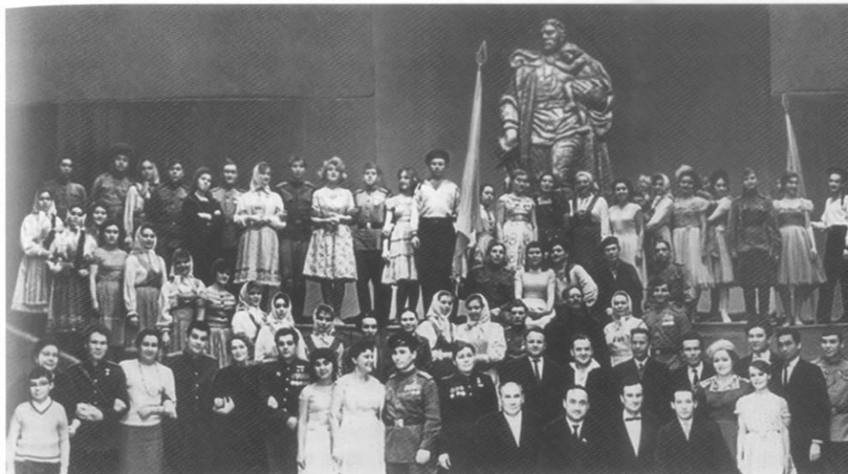
На премьере оперы А.В. Асламаса «Прерванный вальс» в Чувашском музыкальном театре. 1963 г.

ревню, где стал работать учетчиком в колхозе. В сентябре 1942 г. он был призван в армию. Отец отвез его на станцию Вурнары, откуда юношу отправили в марийские леса в запасной полк. «Там нас заставляли строить огромные землянки, — рассказывал композитор, — кормили ужасно плохо, осенью было сыро и холодно. Солдаты стали дезертировать, одного из них расстреляли перед строем полка. Через полвека мы узнали, что нас в ноябре должны были отправить под Сталинград, но приезд маршала К.Е. Ворошилова изменил планы — нас, солдат со средним образованием, отправили в город Ярославль, в Новоград-Волынское военное пехотное училище». Через 3,5 месяца курсантов, еще не завершивших учебу, послали на фронт, под Тулу. Первое боевое крещение Анисим получил на Орловско-Курской дуге. В качестве связиста-телефониста он прошел с боями земли Белоруссии, Восточной Пруссии, Польши — до самого Берлина и дальше до Эльбы (Магдебурга). Был начальником управления