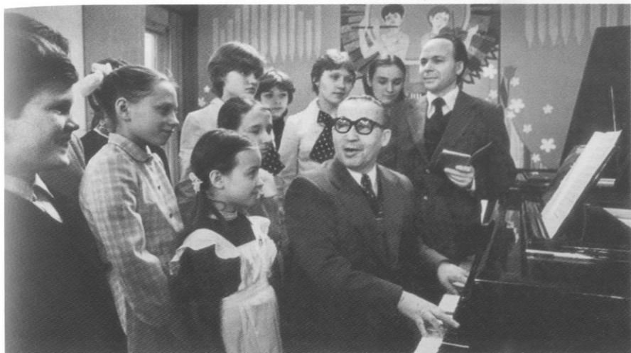
Встреча с юными слушателями в Чебоксарской детской музыкальной школе им. С.М. Максимова.