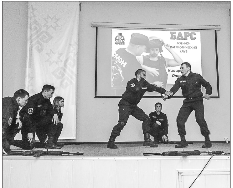
▲ На одном из уроков члены военно-патриотического клуба «БАРС» продемонстрировали приёмы отражения рукопашной атаки и вооружённого нападения

Уроки правовой культуры и уроки мира, гражданско-патриотические акции и интернациональные праздники, имеющие большое социальное значение, вызывают интерес у студентов и преподавателей. Каждое мероприятие посещает от 100 до 200 человек. Такая практика значительно расширяет нашу