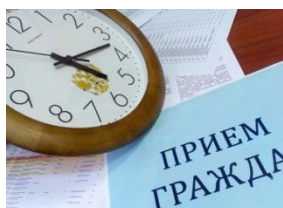
График проведения Дней малого и среднего предпринимательства в муниципальных районах и городских округах Чувашской Республики

Общественные объединения предпринимателей Чувашской Республики - http://mb.cap.ru/SiteMap.aspx?gov_id=49&id=175324&title=Obschestvennie_objedineniya_predprinimatelej