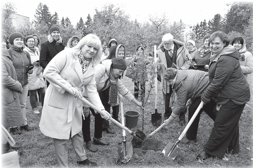
Участники «Библиокаравана» сажают дерево в Саду-парке им. А.Г. Николаева (с. Шоршелы)

Одним из значимых мероприятий «Библиокаравана» стал юбилейный XX Всероссийский научно-практический семинар «Проблемы краеведческой деятельности