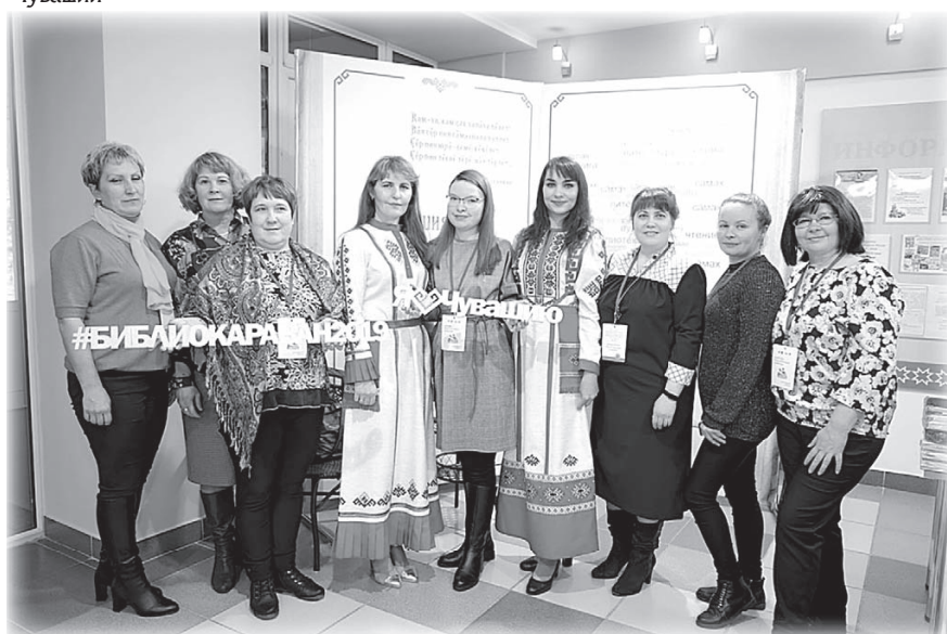
Участники форума в Национальной библиотеке Чувашии

Коллеги познакомились с историей Ядрина и посетили Музей натурального хозяйства чувашского крестьянина XIX в. в деревне Верхние Ачаки. Костюмы, декорации и обращение к реальным фактам позволили гостям почувствовать особую историческую атмосферу. Вместе с народным ансамблем песни и танца «Вирьял» присутствующие окунулись в мир чу-