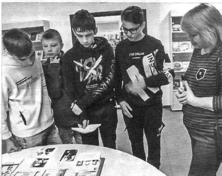
Школьники из г. Канаш в рамках проекта «День в столице» участвовали в увлекательной квест-экскурсии «Чувашия: книги и люди» по «Пушкинской карте» и стали героями репортажа Национальной телерадиокомпании