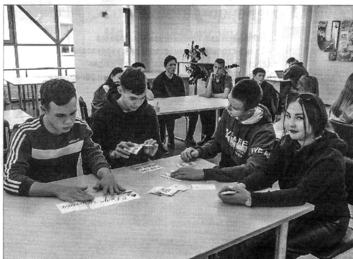
▲ Ученики из Ибресинского района сразились в интеллектуальном турнире в честь Александра Невского «Кто с мечом к нам придёт – от меча и погибнет»