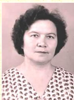
КАНЮКОВА Александра Семёновна (1919–2008)