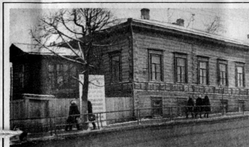
Здесь размещалась библиотека в 20-х годах... и с 1940 по 1972 годы.