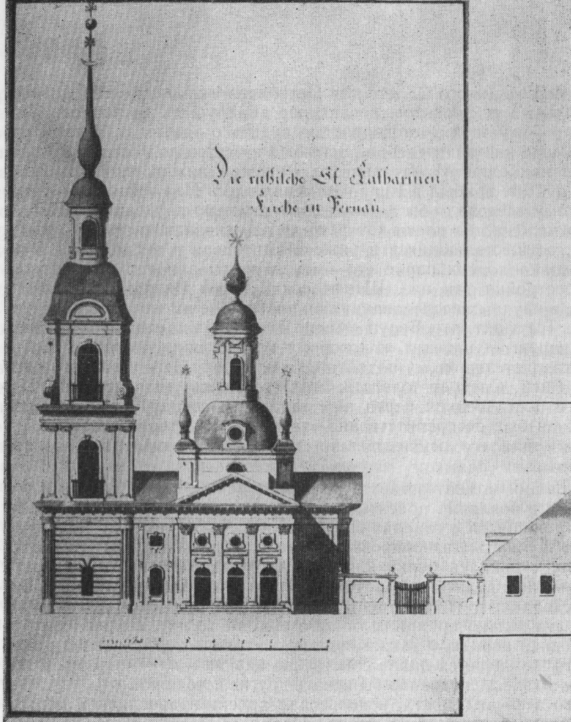
Фасад. Чертеж И.-Х. Бротце.