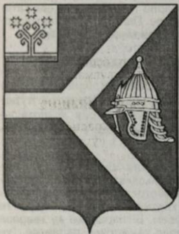
Красноармейски районён гербё