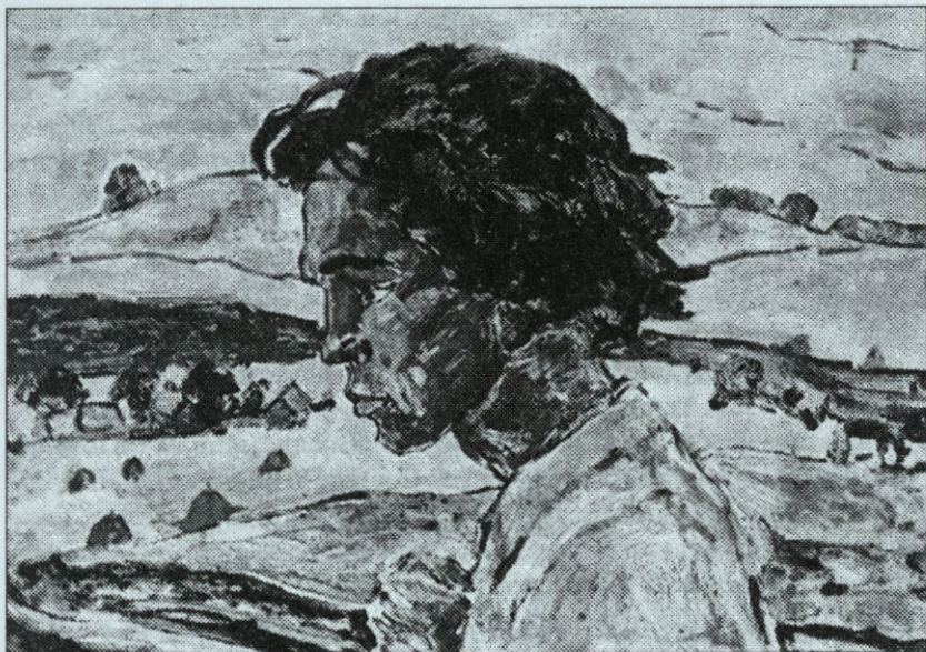
Н.И. Садюков. Думы (М. Сеспель). 1966.

волны, диковинные формы прибрежных скал – все это глубоко символично и очень образно «аккомпанирует» душевному состоянию поэта.