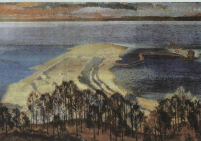
Э. Юрьев. «Верхняя перемычка». Из серии «Чебоксарская ГЭС». 1970-е гг.

труженика, чувашская промышленная графика заговорила собственным языком, имеющим национальные корни.