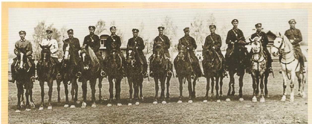
К 1925 году конный резерв Чебоксарской городской милиции состоял из 30 лошадей.