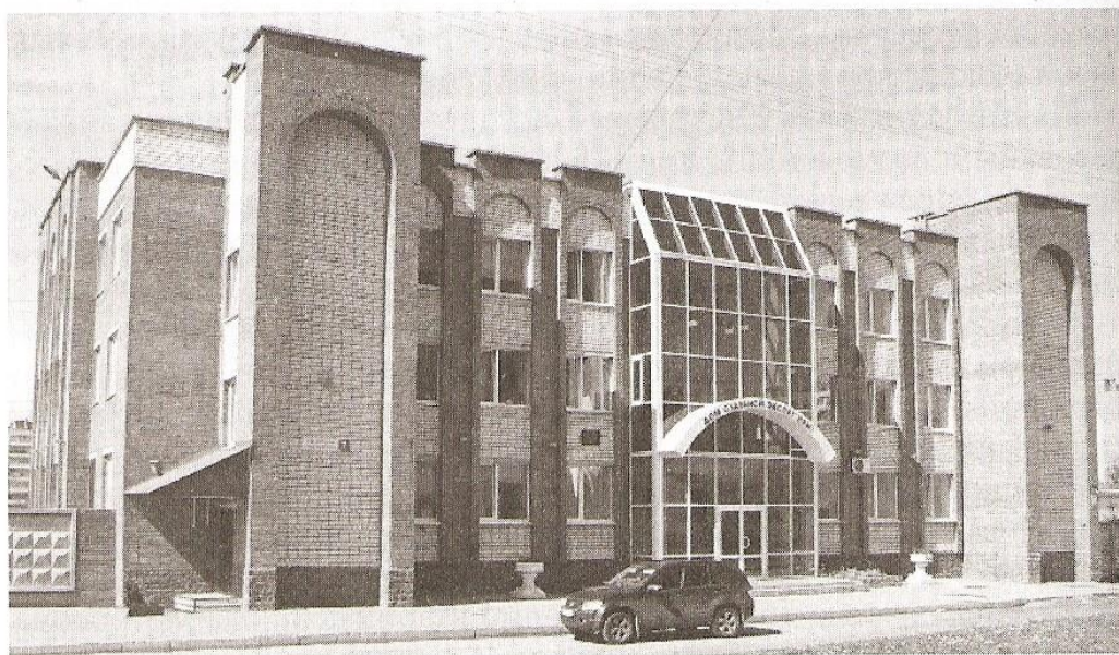
Здание ФБУ Чувашской лаборатории судебной экспертизы.